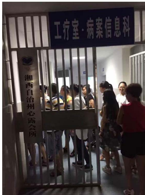
(图10：实习——走进荣复医院与医生，病人谈话)