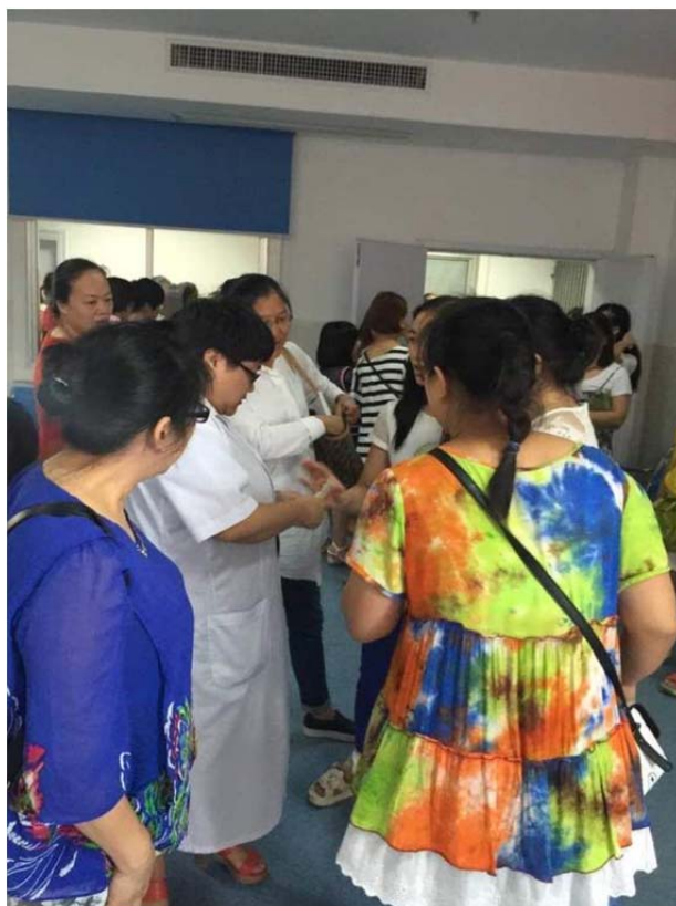
(图 12：老师们自发为病人们捐款，希望他们早日康复)