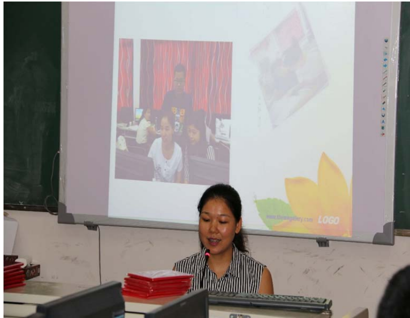
( 图片 5 : 小组汇报 )