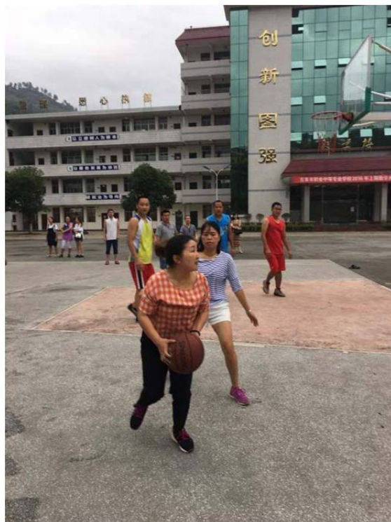
(图4：班级男女混合篮球赛)