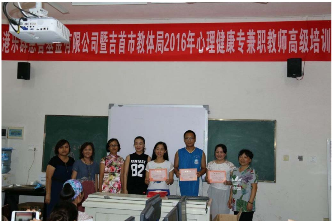
(图8：优秀班干部合影)