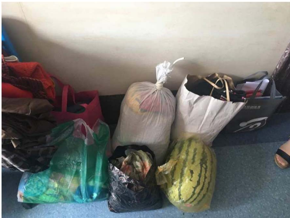
(图 11：老师们为荣复医院病人捐赠的衣物和水果)